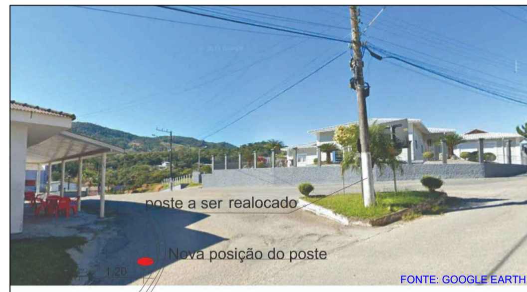
2 IMAGEM - REALOCAMENTO DO POSTE SEM ESCALA